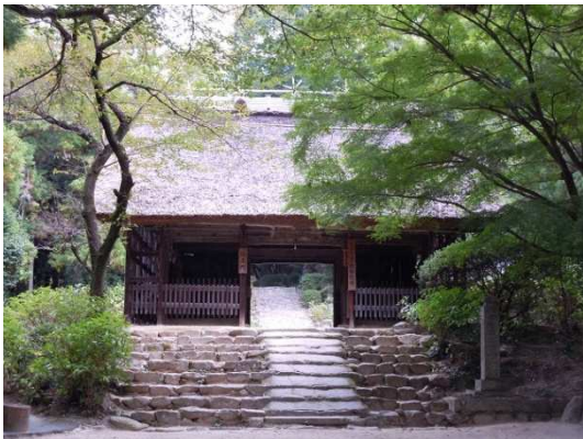
茅葺きの山門の両側には鎌倉時代を代表する仏師・快慶一派の作とされる2体の金剛力士像、阿形像と吽形像が立つ。

平安時代末期、源氏と平家の抗争によって壊滅の危機に瀕した東大寺の復興事業を指導したのが、老僧・俊乗房重源であり、その拠点となったのが阿弥陀寺でした。