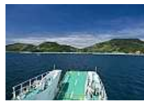
船より大津島を望む