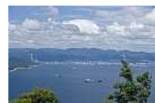
大津島より周南市を望む